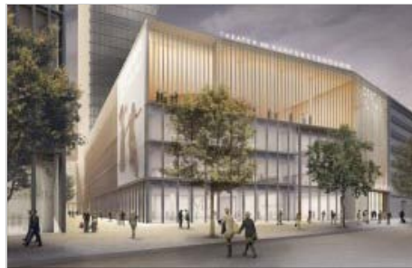
Chipperfields Planung für das Kudammkarree.

Der irische Entwickler Ballymore will den 500 Mio. Euro schweren Umbau des Kudammkarrees nicht alleine stemmen. Wie das Unternehmen über einen Sprecher auf Anfrage der IZ mitteilen ließ, wird zurzeit nach einem Partner für das Vorhaben mit der Adresse Kurfürstendamm 206-209 gesucht.