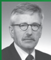
Dr. Thilo Sarrazin Senator für Finanzen des Landes Berlin